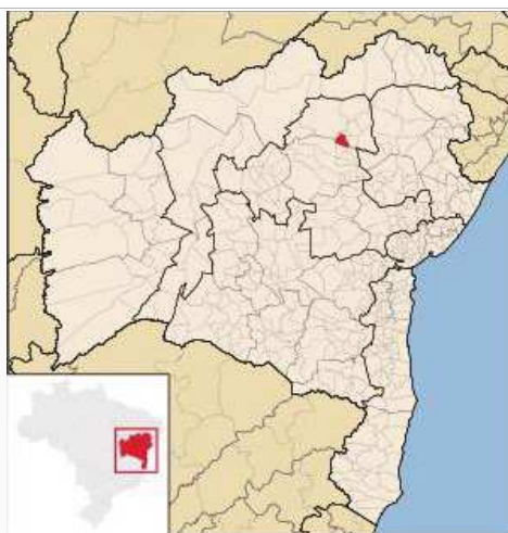
Localização de Pindobaçu na Bahia