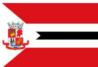
Bandeira Município de Alagoinhas