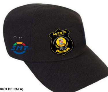
GORRO DE PALA)

Avenida Juracy Magalhães nº 334, Alagoas Velha, Alagoas-BA CEP: 48007-314 Tel.: (75) 99999-7536 E-mail: smtt@alagoas.ba.gov.br