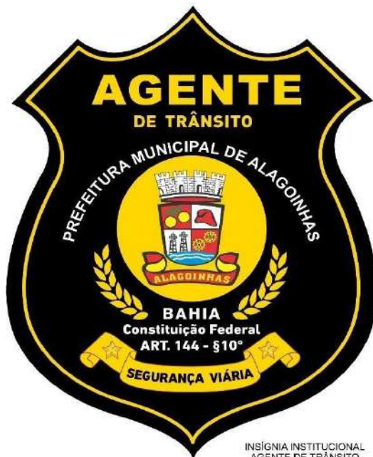
INSÍGNIA INSTITUCIONAL AGENTE DE TRÂNSITO