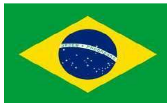
Bandeira do Brasil

Avenida Juracy Magalhães nº 334, Alagoinhas Velha, Alagoinhas-BA CEP: 48007-314 Tel.: (75) 99999-7536 E-mail: smtt@alagoinhas.ba.gov.br