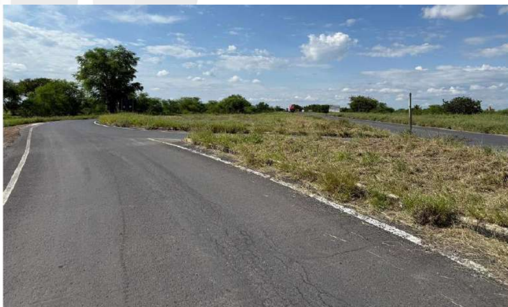
Figura 3 vista 3 dos canteiros da rotatória

Praça João Nery de Santana, 197, Centro Oliveira dos Brejinhos - BA CEP: 47.530-000