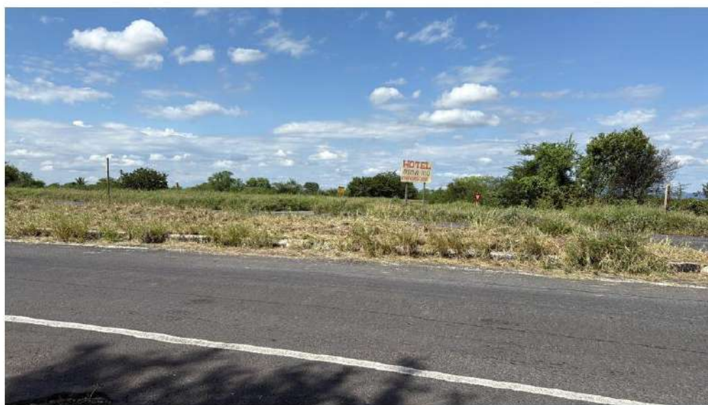
Figura 1: vista 1 dos canteiros da rotatória

Observação: Todas as imagens abaixo são de acervo pessoal do Setor de Infraestrutura da Prefeitura Municipal de Oliveira dos Brejinhos, realizadas “in loco” durante visitas de levantamento técnico realizadas em abril de 2025.